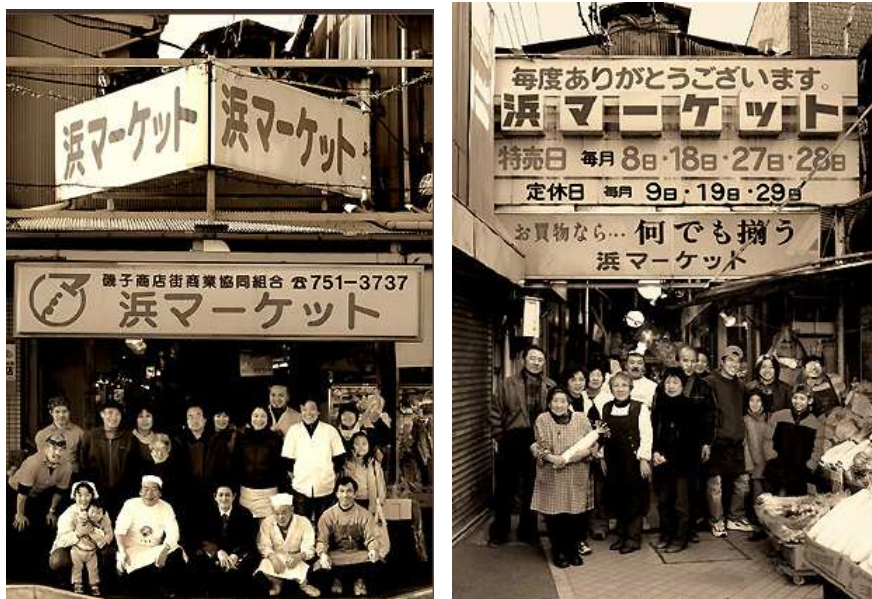
▲地元住民が一丸となり復興に取り組んでいる浜マーケット

夢の街では、商店街との提携事業を新しく育成させると共に、地域活性化に協力して参ります。