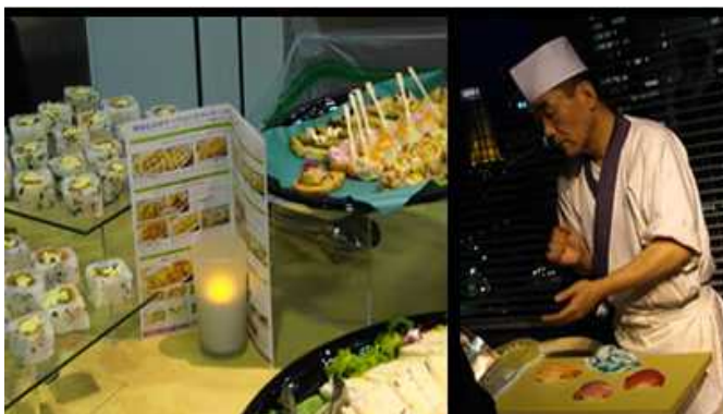
過去の試食会風景。その場で寿司を握り、来場者に振舞いました。

当日は、マスコミ関係者も多数いらっしゃいます。可能な範囲でご意見をお聞きすることもございます。