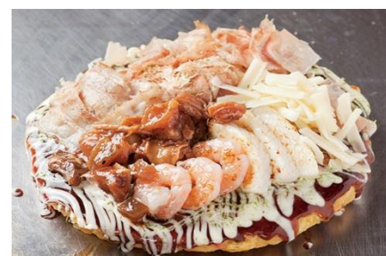
道頓堀焼き（大盛） 1,730 円