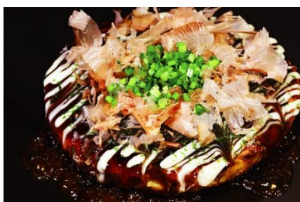
豚玉新味（グルテンフリー） 1,280 円