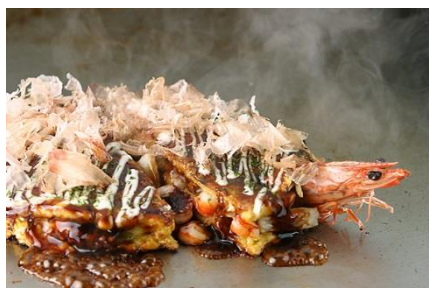
千房焼（大盛） 2,160 円