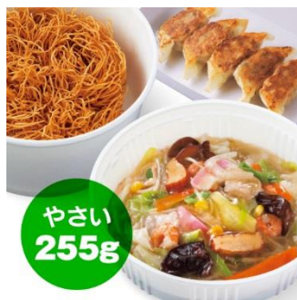
長崎皿うどん+ぎょうざ 5個セット 1,260円