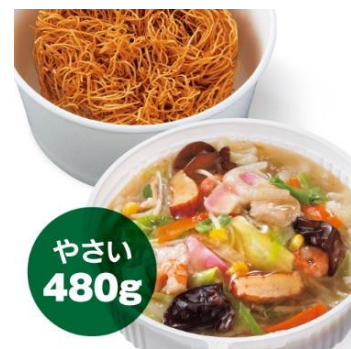
野菜たっぷり皿うどん 1,100円