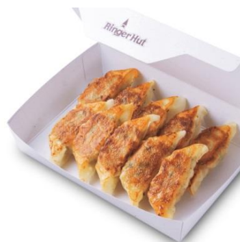
ぎょうざ 10個 740円